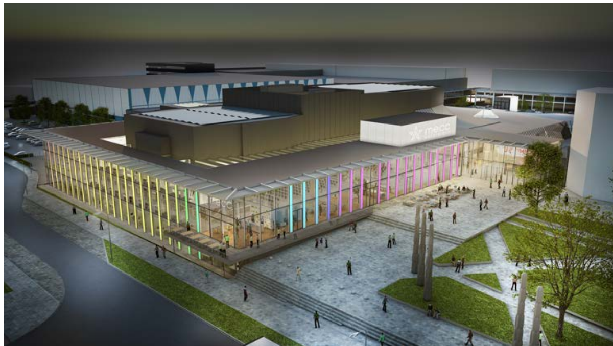
Het nieuwe MECC