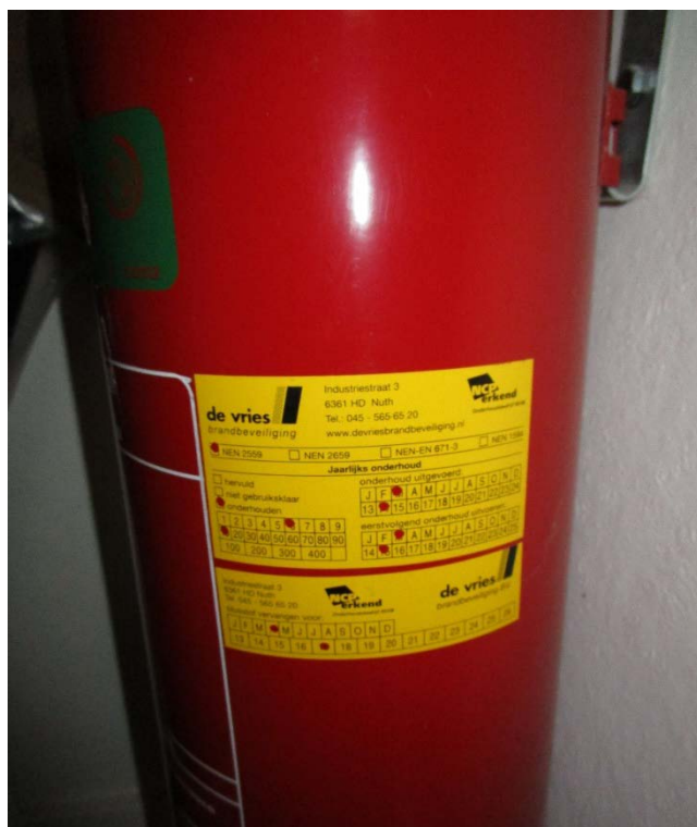
Foto: brandblusser met keuringslabel