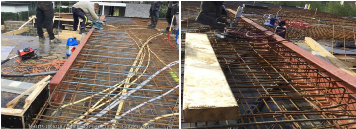
Werk in uitvoering

Met een nog actuele hoge werkvoorraad vraagt de legalisaties van studentenpanden en de nieuwe aangevraagde woningsplitsingen/-omzettingen van studentenkamers in het bouwtoezicht zeker nog bijzondere aandacht. Op onderdelen zal het noodzakelijk zijn meer en strenger het handhavingsinstrumentarium in te zetten.