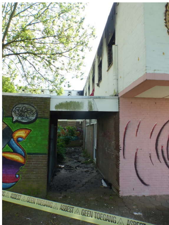
Foto: vrijkomen asbest na brand

We zien een lichte toename van relatief kleinschalige asbestsaneringen. Waarschijnlijk is de aankomende (dure) saneringsverplichting de oorzaak hiervan. Particulieren mogen zonder hulp van een erkende saneerder, een beperkt aantal vierkante meters golfplaten zelf van het dak verwijderen, echter zonder ze te breken. Wij constateren dat deze kleinschalige asbestsaneringen nogal eens onoordeelkundig en daarmee gevaarlijk worden uitgevoerd.