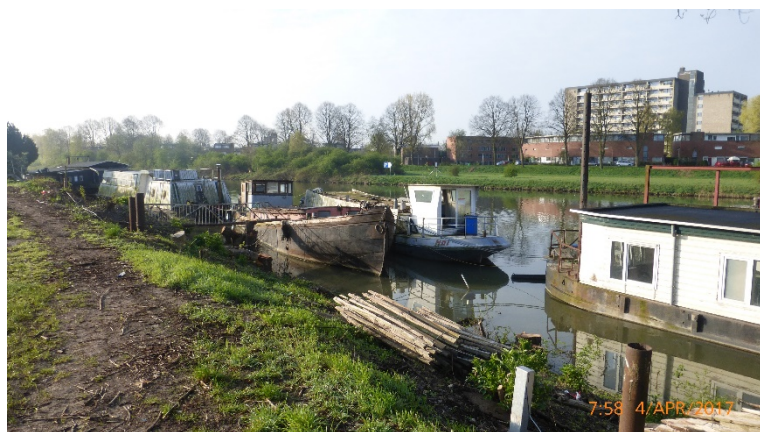
Foto: woonbootlocatie Stuwweg

Voor de woonboten langs de Zuid Willemsvaart (36 ligplaatsen) heeft de gemeente ligplaatsvergunningen verleend. In 2018 is gestart met de handhaving en dit is in 2019 doorgezet. Het resultaat is in 2019 zichtbaar geworden. Schuttingen en erfafscheidingen zijn verlaagd, verwijderd conform regels. Met de woonbootbewoners zijn afspraken gemaakt over de opschoning van de percelen en het nakomen van de regels van het bestemmingsplan en de APV. In enkele gevallen is daarbij handhavend opgetreden.