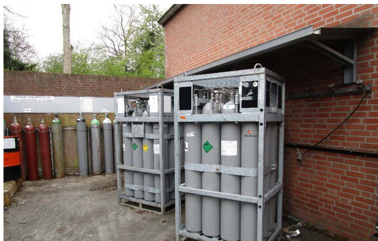
Foto: opstelplaats gasflessen

De planning ten aanzien van de reguliere inspecties is niet gehaald. Aanleiding hiervan is het oplopen van het aantal klachtmeldingen. Klachtmeldingen over milieuklachten worden altijd nagetrokken. De niet gecontroleerde bedrijven schuiven door naar 2020.